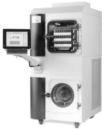
Système LyoStar II de FTS exécutant la technologie SMART Freeze-Dryer

La lyophilisation est une méthode ayant fait ses preuves et permettant d'augmenter considérablement la durée de vie et la stabilité d'une large gamme de produits instables à l'état natif. La nécessité croissante de développer des procédés de lyophilisation de pointe s'explique par l'importance grandissante des traitements à base de protéines. En vue de rationaliser la procédure d'agrément dans le domaine du développement de médicaments, les cycles doivent à présent être justifiés pour chaque produit en particulier. L'objectif est d'obtenir un cycle optimal, conçu en fonction des propriétés thermiques uniques de chaque composition. Le lyophilisateur Smart™ offre au formateur scientifique une technologie pour l'optimisation des cycles, de manière à obtenir le cycle le plus efficace en n'ayant recours qu'à une seule lyophilisation.